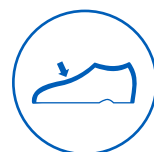
Fața exterioră superioară